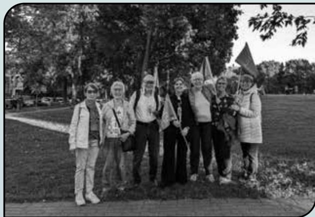
Des participants à la marche Pour la suite du monde.

Danielle Wolfe Secteur Du Ruisseau Raimbault (06-B)