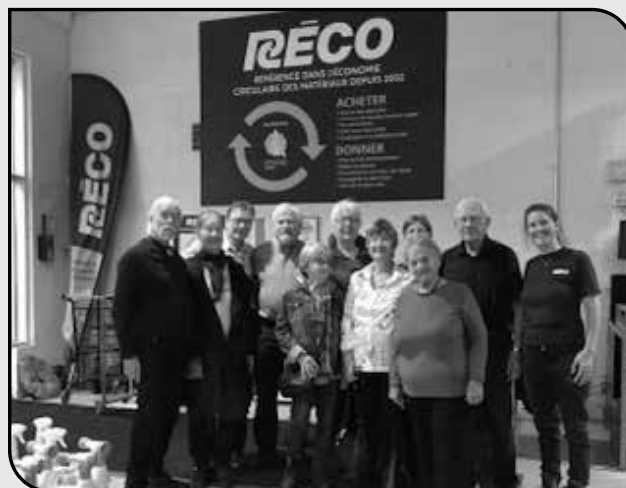
Des membres de différents secteurs chez Reco.