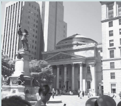
Où peut bien être Jeanne Mance sur cette photo?

Si vous devez annuler, prière d'avertir le plus tôt possible.